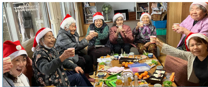
紹介事例1 よなしろ ゆんたくサロン（よなしろ）