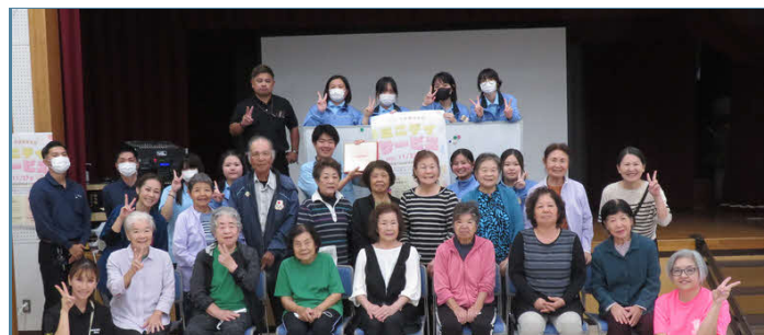
紹介事例2 田場カフェ（具志川ひがし）