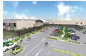
農水産業振興戦略拠点施設(イメージ)

平成30年春頃オープン予定の当施設への農水産物、加工食品及び工芸・雑貨等の商品の出品者を募集しております。