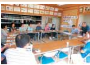
【内間】【内間のルーツめぐり講座】 内間の発祥地はどこだろう？座談会や視察学習を行いました。