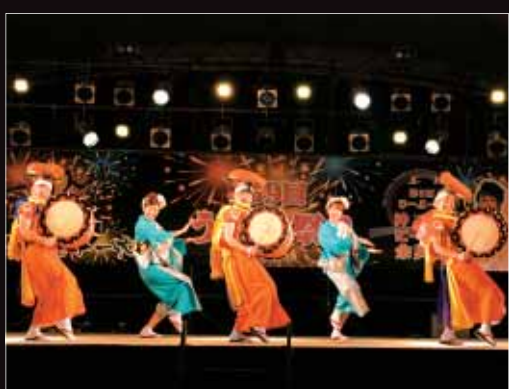
【盛岡さんさ踊り（うるま祭り）】