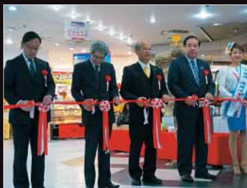
【ちゅらしま大沖路店 (株式会社 川徳)】