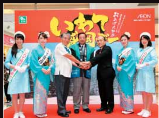
【いわて盛岡デー(イオン具志川店)】