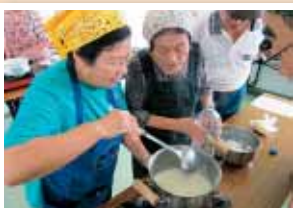
【みどり町3・4丁目】 【絵手紙を描こう！ゆしどうふ作り体験】 ゆしどうふづくりでは、宮城島から汲んだ海水を使って自然そのままの味を頂きました。