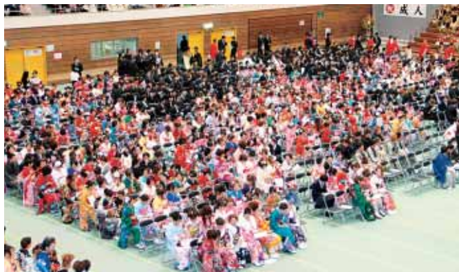
男性712人女性701人 計1,413人の新成人