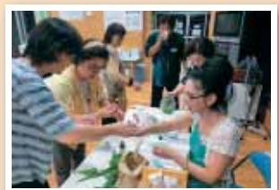
【旭区】【アロマクラフト講座】 アロマの香に包まれ、一日の疲れも吹き飛びました。