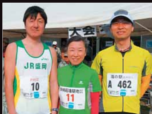
【盛岡市からのゲストランナー(あやほし海中ロードレース大会)】

現在では東北新幹線（盛岡・東京間約2時間20分）と秋田新幹線、東北縦貫自動車道などが通り、首都圏や東北各地への交通の利便が高い北東北の拠点であり、「人々が集まり・人にやさしい・世界に通ずる元気なまち盛岡」をまちづくりの目標として取り組み、にぎわいと安らぎのある北東北をリードし、要となる拠点都市としてさらなる発展が期待されています。