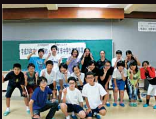
【うるま市・盛岡市中学生交流事業】