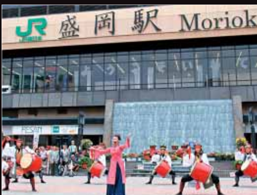
【琉球歌舞団 紅華風(盛岡駅前)】