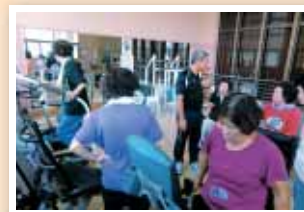
【松島】【がんじゅう体操講座】 初めて体験した運動器具に興味津々！体を鍛えるのにいいね。