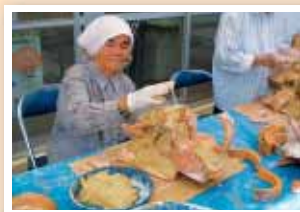
【池味】【しっくいシーサー作り講座】 赤瓦を大胆に使ったしっくいシーサーづくり。大盛況！