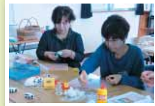
【樹脂粘土で作る干支飾り】 指先から伝わる刺激に癒され、興味を広げることができた！

地域の伝統行事や見識を深める講座から、物作りや健康づくり等、自治公民館のニーズにあわせて講座を支援しました。