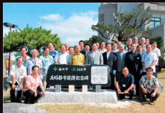
【記念碑の除幕式にて】