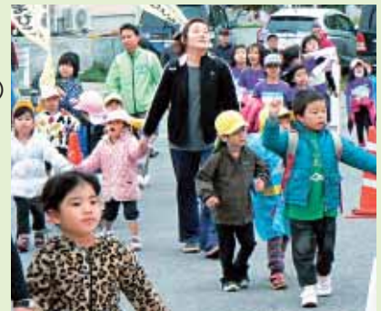
【昨年の参加者の様子】