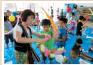
【志林川】【夏休みチャレンジ！ 食・物作り体験講座】 バルーンアート。ねじって・結んで・またねじって風船が割れないかドキドキ！