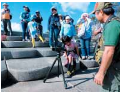
【親子で楽しむ野鳥観察】 レンズをのぞくと野鳥がエサをついばんでいた。思わず「見えた〜！」