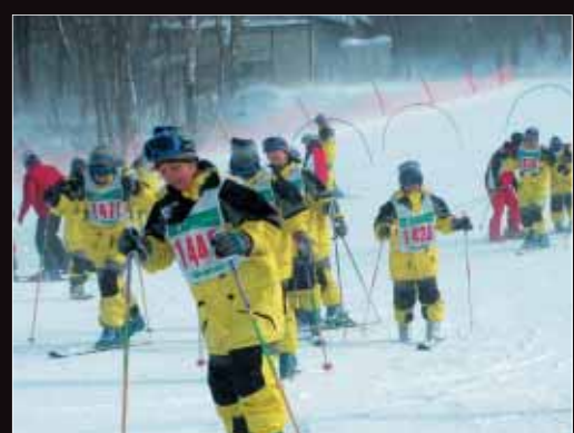
【うるま市・盛岡市中学生交流事業（盛岡市）】