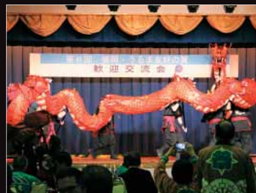
【盛岡・うるま友好の翼】