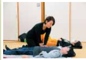
【腸もみ講座】 「便通が良くなった」など自身の体の変化を実感できた。