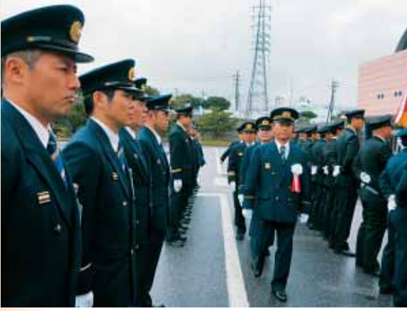
市長、消防長、消防団長による特別点検

式典では、市長訓辞、消防功労表彰が行われた他、幼年消防クラブによる防火演技が披露されました。また、屋外では、炊き出し訓練や煙体験コーナー、消防職団員合同による総合訓練が披露され、瓦礫や車に閉じ込められた被災者を救出し病院へ搬送する想定など本番さながらの訓練を展開しました。