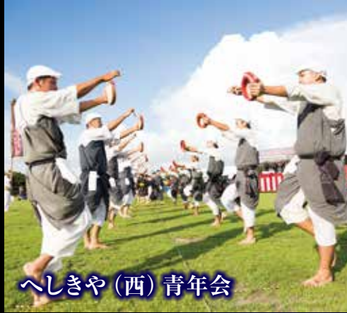
へしきや(西)青年会