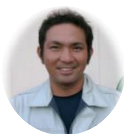
キャベツ・ほうれん草など ：志誠会