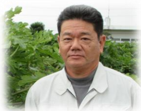
パパイア・生しいたけなど ：合同会社あんり