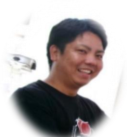
きゅうり・トマトなど ：トマタツファーム