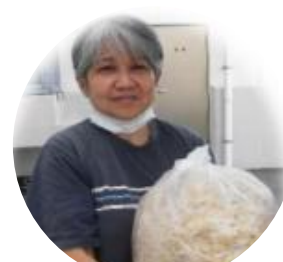
もやし：崎間もやし