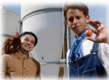
くがに卵：徳森養鶏場