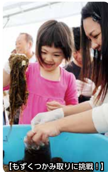
【もずくつかみ取りに挑戦!】