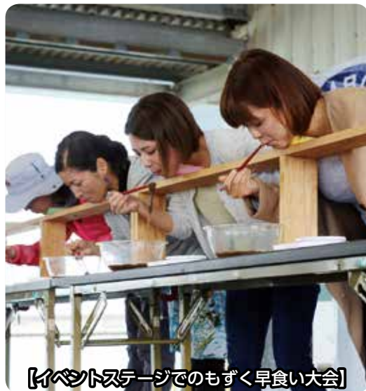
【イベントステージでのもずく早食い大会】