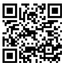
電子申請フォーム