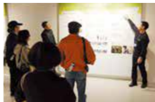
【真剣に説明を聞く参加者ら】

去る2月8日、災害時において地域で中心的な活動を担う各自主防災組織リーダー並びに各自治会長等を対象に、地域の防災力強化や防災意識及び知識の向上を目的とした「平成30年度第2回防災研修会」を「名護市防災研修センター」において実施しました。同施設では大型スクリーンを使用した防災講話を始め、参加者が施設の設備にて災害を疑似体験しました。また、屋上に防災ヘリポートを備えた名護市消防本部の施設見学も行いました。