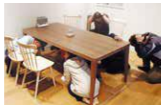
【災害の疑似体験の様子】