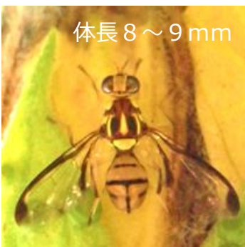
セグロウリミバエ