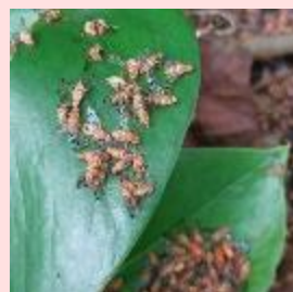
人力での放飼(左)と放飼された成虫(右)