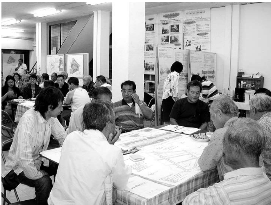
住民参加のまちづくりワークショップ