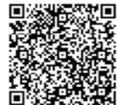
▲禁煙治療に保険が使える医療機関