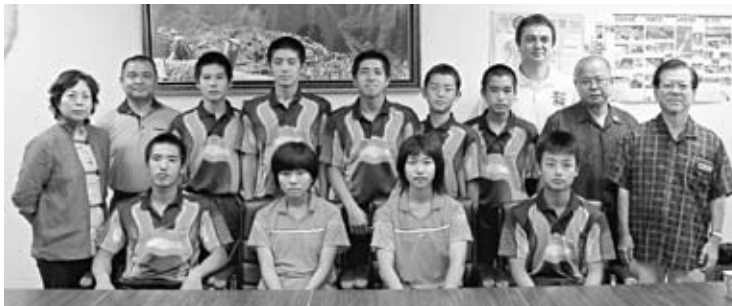
▲バドミントン男子団体・個人(シングルス・ダブルス)優勝、女子ダブルス3位の報告に訪れた宮城中学校の選手の皆さん