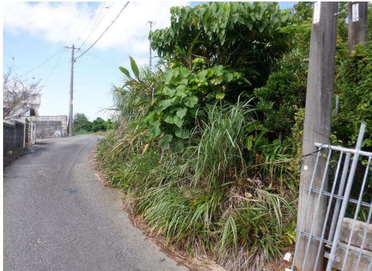
物件No.③〔栄野比松尾原393〕