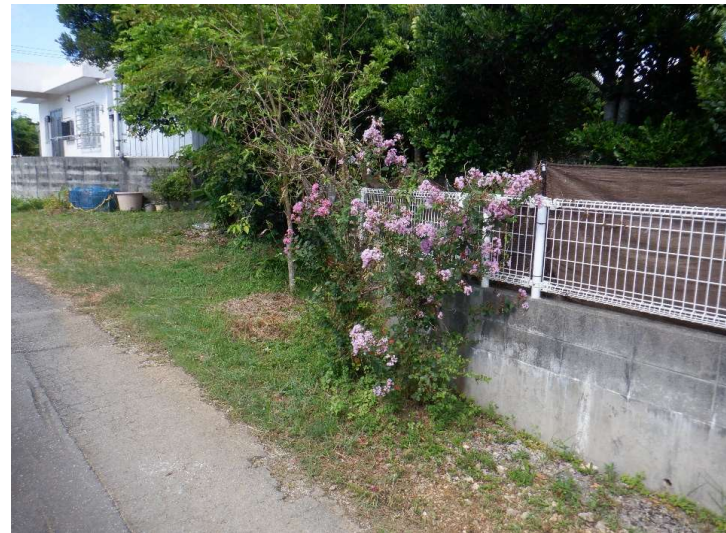
物件No.②-1〔栄野比松尾原384〕