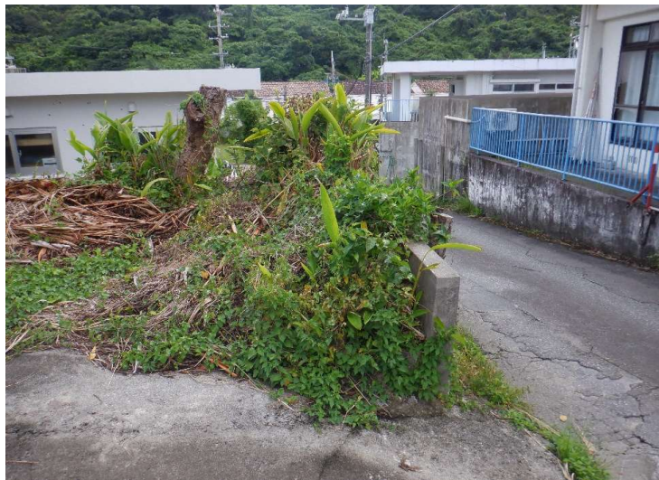
物件No.⑦-2〔栄野比松尾原424-2〕