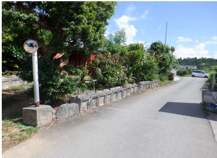
物件No.①〔栄野比松尾原377〕