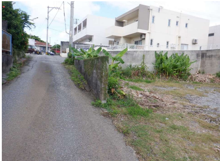
物件No.⑦-1〔栄野比松尾原424-1〕