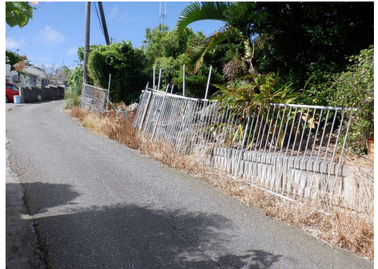
物件No.④〔栄野比松尾原394〕