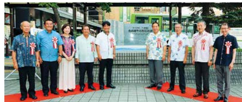
うるま市・盛岡市友好都市提携記念碑除幕式