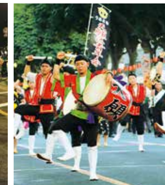
パレードの先陣を切って、力強く踊る天願区青年会