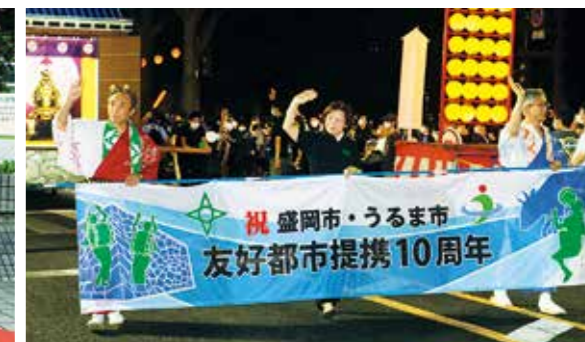
「盛岡さんさ踊り」パレードに参加したうるま市訪問団