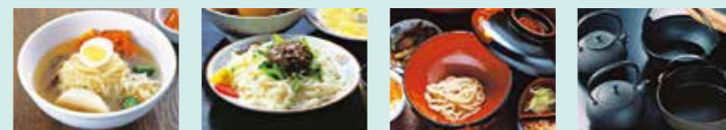
盛岡冷麺 盛岡じゃじゃ麺 わんこそば 南部鉄器

盛岡市は、全国に誇る麺文化のまちで、「盛岡冷麺」、「盛岡じゃじゃ麺」、「わんこそば」は盛岡三大麺として有名です。伝統的工芸品である南部鉄器は海外からも注目されています。また、8月に行われる夏祭り「盛岡さんさ踊り」は、盛岡の夏の風物詩となっています。魅力あふれる盛岡を訪れてみてはいかがでしょうか。