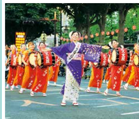
「盛岡さんさ踊り」独特の衣装とリズム、振りの伝統さんさ踊りや彩り鮮やかな花車がパレードを盛り上げます。