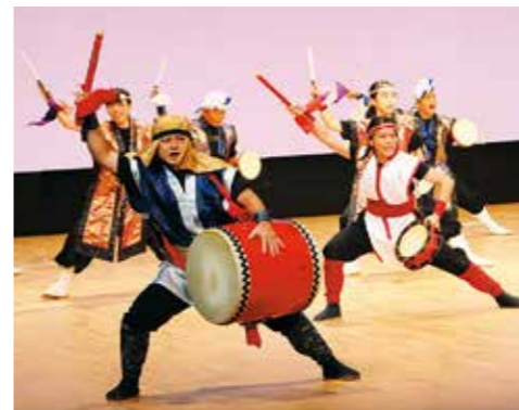
「伝統さんさ踊り競演会」での田場・龍神伝説 琉球 一般公募により参加したうるまさんさ踊り隊のみなさん 獅子団による演武