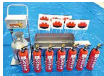
模擬消火訓練装置、訓練用消火器、訓練用まど

消防本部では、一般財団法人自治総合センターの宝くじ社会貢献広報事業として、宝くじの受託事業収入を財源として実施しているコミュニティ助成事業を活用して「模擬消火訓練資器材」を整備しました。