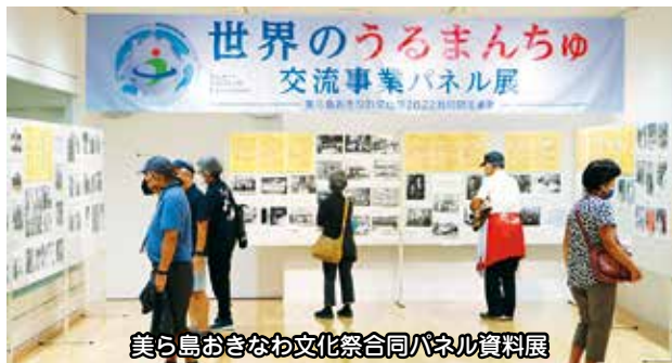
美ら島おきなわ文化祭合同パネル資料展

第7回世界のウチナーンチュ大会に参加している、本市に縁ゆかりのある海外県系人を歓迎する「世界のうるまんちゅ交流レセプション2022」が、11月2日に開催されました。海外から約100人、県内から約100人が参加し、親せきや知人などと交流を深めました。 レセプションでは、具志川かつしん太鼓や琉球歌舞団紅華風KAFUとシカゴ沖縄県人会がコラボした創作エイサーが披露され、最後には5年後の再会と「うるまんちゅ」の健康を願ってカチャーシーを踊りました。 沖縄の「うるまんちゅ」と世界で活躍している「うるまんちゅ」の方々が互いの絆を深める機会となりました。