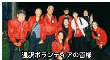
通訳ボランティアの皆様