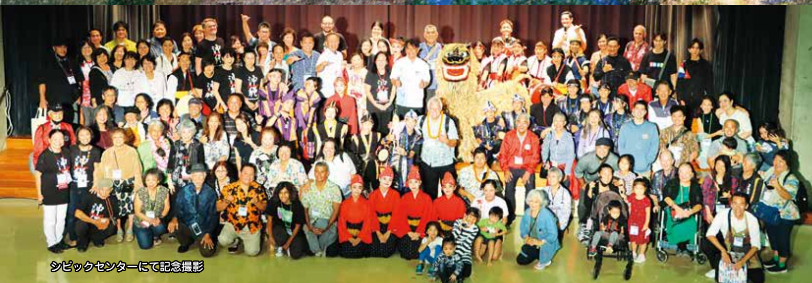
シピックセンターにて記念撮影