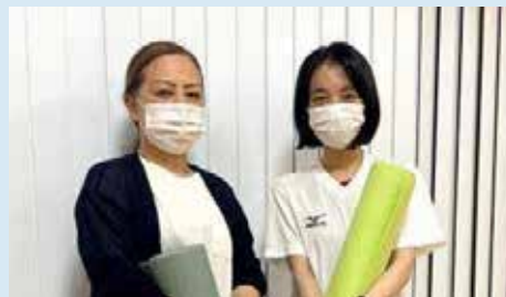
今回お話を聞いた方 (左から)

上記講座は、有料のプログラムです。通常の土曜日クラスも随時受付中。お申込み・お問合せは、うるみん管理室へお問合せいただくかQRコードから!!