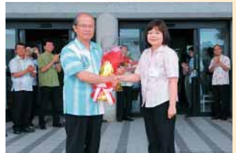
2期目の登庁で職員から歓迎を受ける島袋市長(5/15)