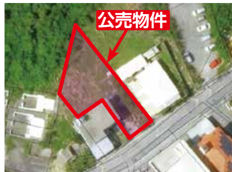
うるま市宇西原ブリク原844番2 畑 376㎡

【お問い合わせ先】うるま市役所 納税課 滞納整理係 ☎098-973-1099・うるま市役所 国民健康保険課 賦課徴収係 ☎098-989-5372