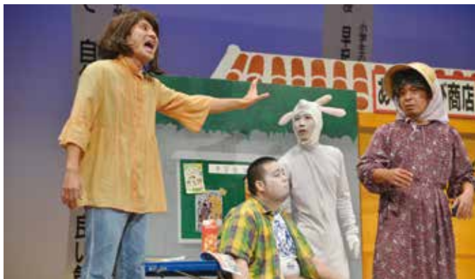
【FECによるお笑い小劇場「あざじゃび商店」】