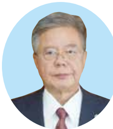
こうき のりのぶ 幸喜 令信氏 (71) 字西原 弁護士功勞 元日本弁護士連合会理事