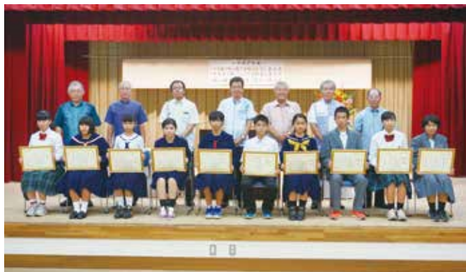
【中学生の税についての作文表彰式】