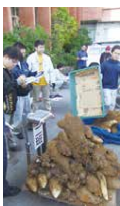
【やまいも計測の様子】

日頃運動不足な生活に有酸素運動を取り入れて、しなやかに引き締まった身体づくりを目指してみませんか？リズムに合わせて楽しく踊ることで生活習慣病の予防をしましょう。