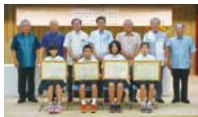
【小学生の税に関する絵はがき表彰式】

「小学生の税に関する絵はがき」「中学生の税についての作文」「税に関する高校生の作文」において、特に優秀と認められた方々への表彰式が11月17日、健康支援センターうるみんで行われました。