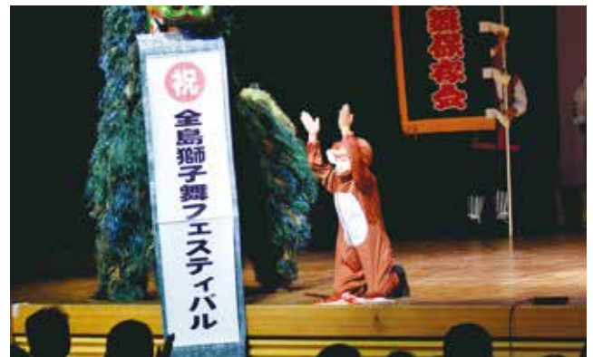
【会場を盛り上げる上江洲獅子舞】