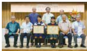
【税に関する高校生の作文表彰式】