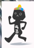
うるまのゆるキャラ うるま266