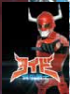
闘牛戦士ワイドー

県内の車いすレーサーが駆け抜ける トリムマラソン3.8km終了後、競技用車イスによる レースを実施予定