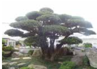
【クロキ大賞市長賞】