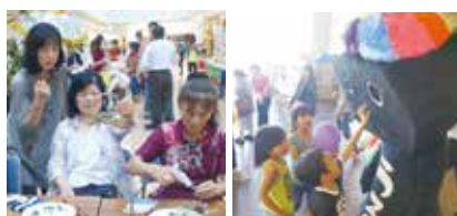
【ステージで盛り上げる出演者】