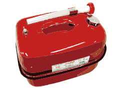
ガソリン缶 (消防法適合品)

はガソリン専用の消防法適合品の金属製容器で60ℓ以下とされています。金属製であっても市販されているオイル缶・混合油缶・ブリキ缶などは運搬容器として認められていません。また、乗用車等で運搬する場合は、22ℓ以下の金属製容器（消防法適合品）に限定されています。