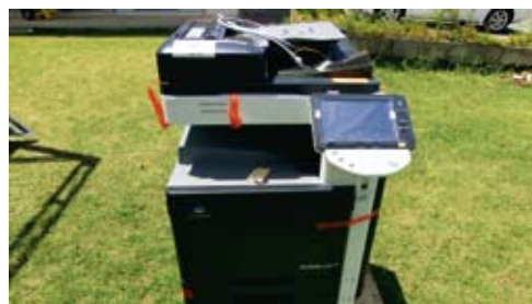
平良川自治会 (コピー機)

コミュニティ助成事業は、財団法人自治総合センターが市区町村に対し、宝くじの助成金でコミュニティ活動に必要な施設や設備の整備を行い、健全発展を図るとともに宝くじの社会貢献広報として行っています。 今年度は、うるま市自治会長会連絡協議会から申請があり、平良川・兼箇段・大田の三自治会に備品が購入されました。