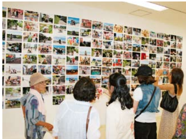
島には多くの観光客が訪れました

旧校舎内には、様々なオブジェの展示や伊計島の海を一望できる「cafeイチハナリ」がオープンしました。また、集落内は、壁画アートなどの作品が置かれ、訪れた島の住民や観光客は、美しい島の風景とアートを楽しんでいました。