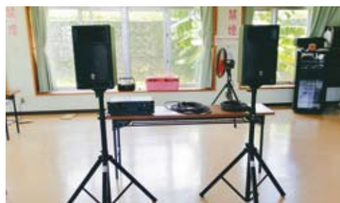
兼箇段自治会 (音響システム)