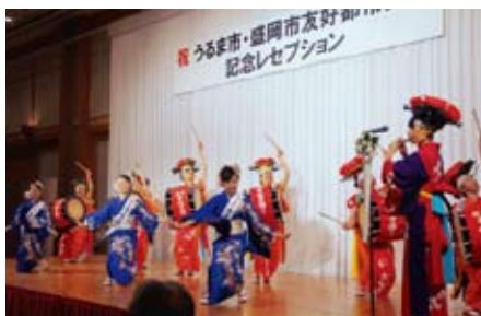
【記念レセプションでのさんさ踊り】