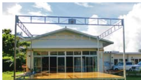
大田自治会 (移動式舞台)