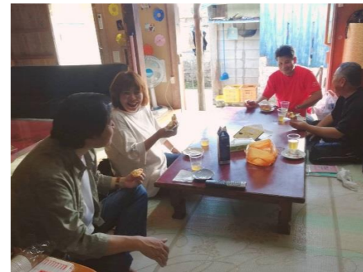
▲参加者とお世話係のゆんたくの様子

今年は、宮城島宮城区のお家を使わせていただき、11月中旬から2月中旬まで開催します。詳細は下記の通りです。集落案内や行事への参加などで地域に混ぜていただくこともあります。ご協力のほど、どうぞよろしくお願い申し上げます。