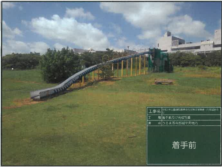
工事名 令和3年山陽福祉教育施設整備事業(与那城地区) 工種 着手前及び完成写真 測点 うるま市与那城中央地内