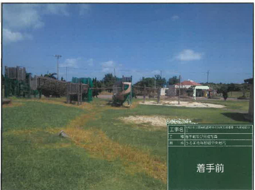
工事名 令和3年「施設等撤去」実施工事(与那城地区) 工種 着手前及び完成写真 測点 うるま市与那城中央地内

工種 :公園施設等撤去工 測点 :うるま市与那城中央地内 複合遊具撤去 施工前 着手前