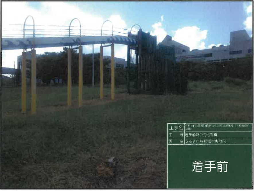
工事名 令和3年山陽福祉教育施設整備事業(与那城地区) 工種 着手前及び完成写真 測点 うるま市与那城中央地内