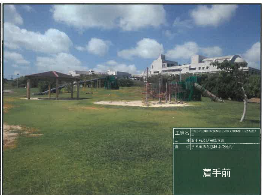
工事名 令和3年「施設等撤去」実施工事(与那城地区) 工種 着手前及び完成写真 測点 うるま市与那城中央地内

工種 :公園施設等撤去工 測点 :うるま市与那城中央地内 複合遊具撤去 施工前 着手前