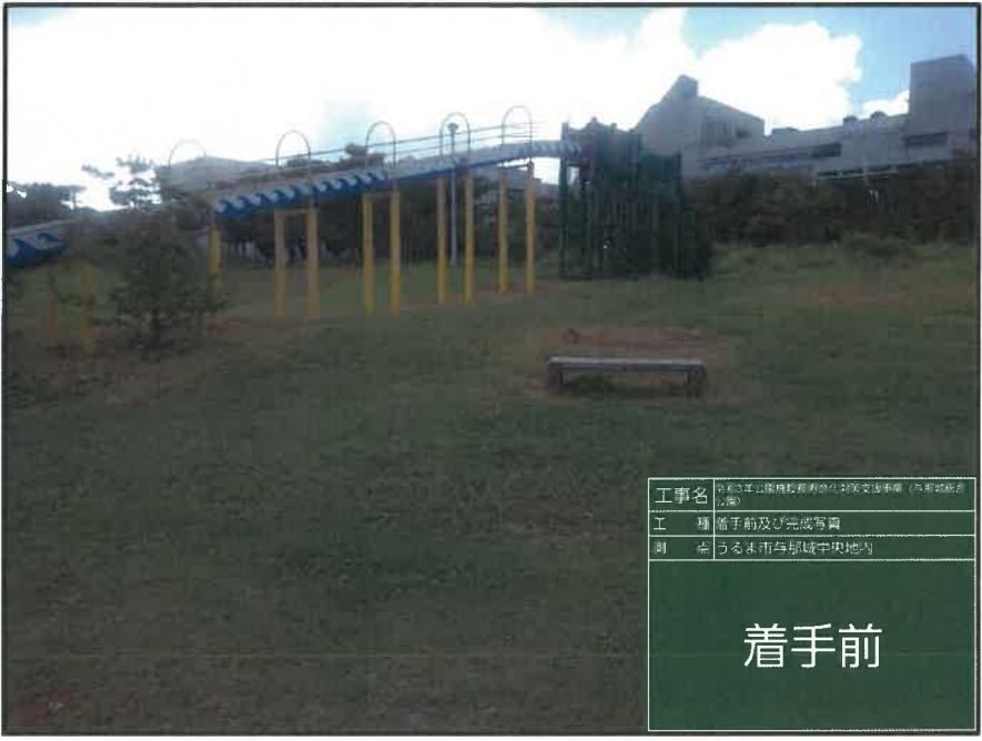
工事名 令和3年山陽福祉教育施設整備事業(与那城地区) 工種 着手前及び完成写真 測点 うるま市与那城中央地内