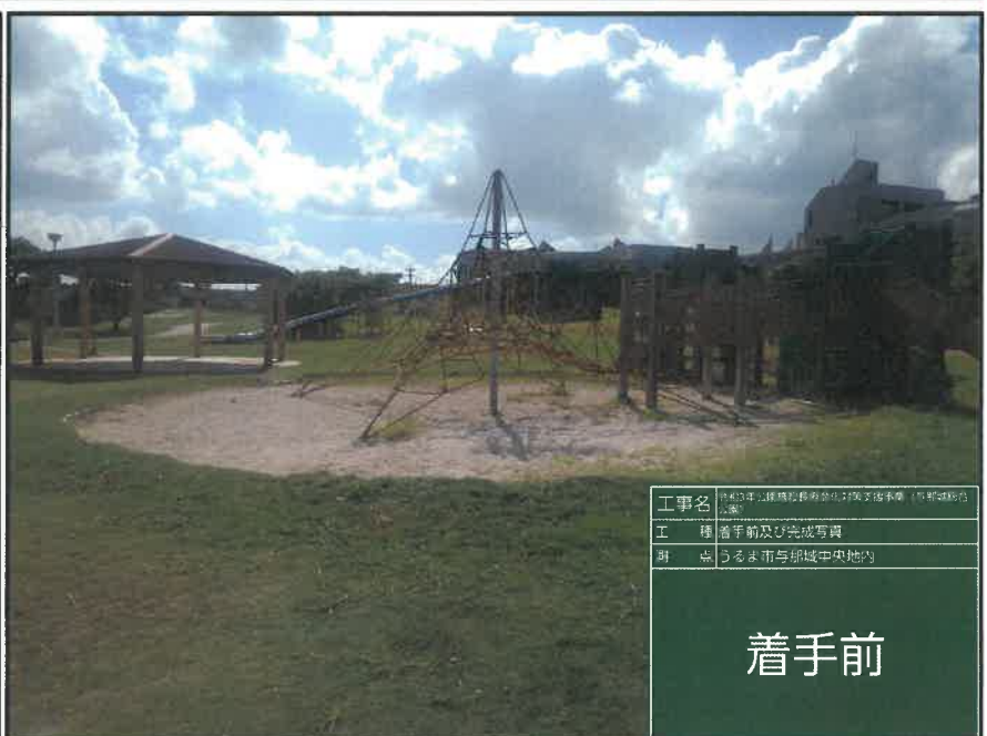
工事名 令和3年「施設等撤去」実施工事(与那城地区) 工種 着手前及び完成写真 測点 うるま市与那城中央地内

工種 :公園施設等撤去工 測点 :うるま市与那城中央地内 複合遊具撤去 施工前 着手前