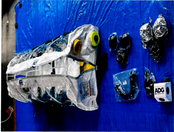
アイソポッド アドバンテージ プラス一式