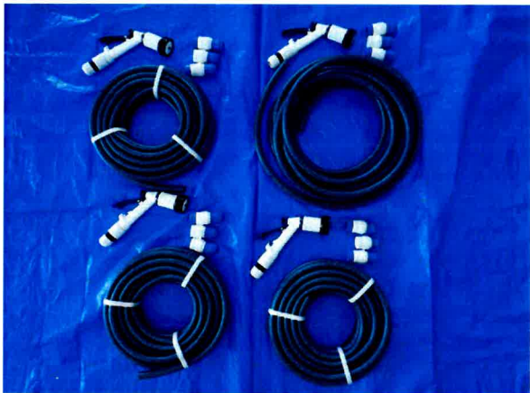
BT-01B (ホースガンアタッチメントセット) ×4個