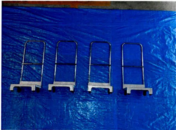
BT-01A (専用キャリー) 4台