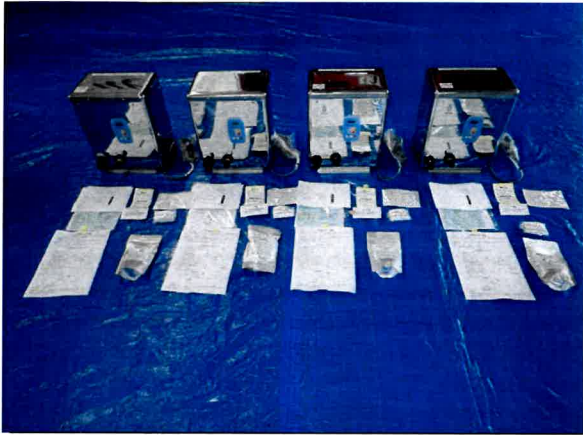
BT-01 (本体) 4台