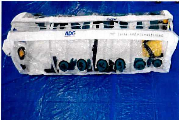
アイソポッド アドバンテージ プラス