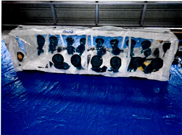
アイソポッド アドバンテージ プラス