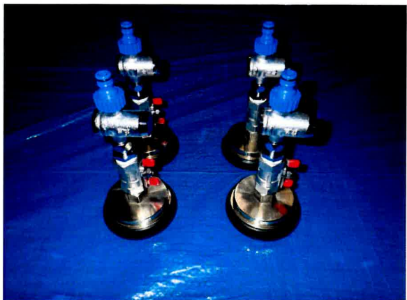
BT-01D (放水車接続アタッチメント) 4個