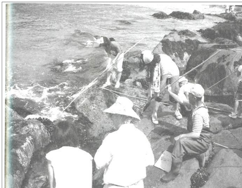
網地島だけの魚釣りアナゴ抜き:岩の下に釣り竿を突っ込んで釣ります。

網地島は東日本大震災の震源地に一番近い離島である。2011年3月11日に宮城県内だけで1万1千人以上の死者・行方不明者を出した東日本大震災の大津波は、網地島を容赦なく襲い、甚大な被害をもたらした。島と本土との海(約4キロ)が割れて改定が見えたほど威力のある大津波だった。港の防波堤や岸壁は徹底的に破壊され、海岸近くにあった家屋や待合所、漁協、ご漁具倉庫等は、すべて海に引きずり込まれてしまった。幸いにもその日は、ちょうどヒジキの口開けがあり、午後はヒジキを屋外で下処理していたため、誰も小船で沖には出ておらず、海で命を落とす人はいなかった。また、一人暮らしのお年寄りや足の悪いお年よりは、住民が手分けして高台に運んだので、編地島では奇跡的に一人の犠牲者も出さずにすんだ。 しかし、島民の希望や意欲を削いだのは、港や砂浜を埋め尽くしたガレキだった。膨大なガレキに圧倒され、多くの島のお年寄りは、涙も出ないくらいに絶望した。誰もがもう編地島ふるさと楽好は開校できないと思った。 震災から3か月が経ったある日。児童養護施設の子どもたちから手紙が届いた。「編地島のおじいちゃん、おばあちゃんたちが心配です。また会いたいです」