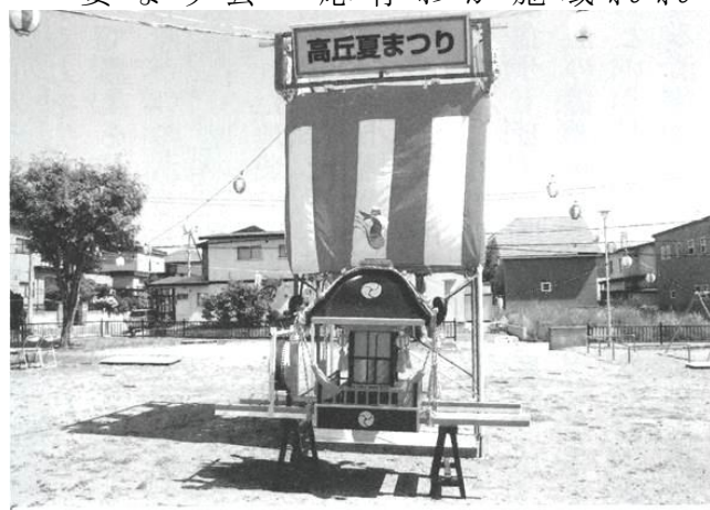
祭り舞台及び新作の子ども神輿

平成28年の夏まつりに参加して頂くことが実現しました。短大からは、延べ107名の参加を得て、今までにない「エアロビクスダンス」「函館がちゃがちゃ」等の実施など若い学生さんの発想で祭りは大いに盛り上がりました。タイトルのネーミングのとおり、一町のみんなが笑顔になる活動にさせていただきました。 高丘町会、函館市、北海道どこも、今後は右肩上がりとなっていくことでしょうか。このような中において、今後の町会運営のあり方は、一工夫も二工夫も考えなければならぬ喫緊の課題です。 高丘町会の一例は、教育機関があるというある意味恵まれているかもしれない。他地域にも色々な実施のための素地があるものと思われまます。町会存立のための対応を今からやるべきであり、町会がなくなりそうになって慌てないためにも必要なことです。