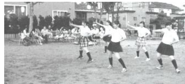
函館短期大学学生によるエアロビクスダンス