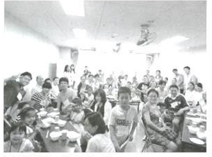
初めての食事会 みんなでホース!

このようにして「二ある地域」の方針①外国人住民を地域の担い手に ②若い大学生を地域に ③地域や地域外の組織を巻き込んだ活動を具体化しつつ、住民同士の交流を促していきました。例えば、外国人住民に対する心無い落書きのあった机に、双方の住民の手形をつけて等団地における日中友好のシンボルにしました。また、日中住民が手作りにしたペットボトルランタンで、天の川を表現するイベントを開催しました。なぜなら、日本の七夕は日中の文化を融合したものといわれており、密接な住民交流への願いを七夕に込めたからです。しかし、イベントの場は盛り上がりつつある一方で、交流しているとは言えない状況が続きました。その理由は、同じ場所に集まっても、別々にイベントを楽しんでいたからです。これでは、同じ形の交流イベントを繰り返しても運営側の自己満足に終わってしまい、住民交流はいつまでも進みそうにありませんでした。