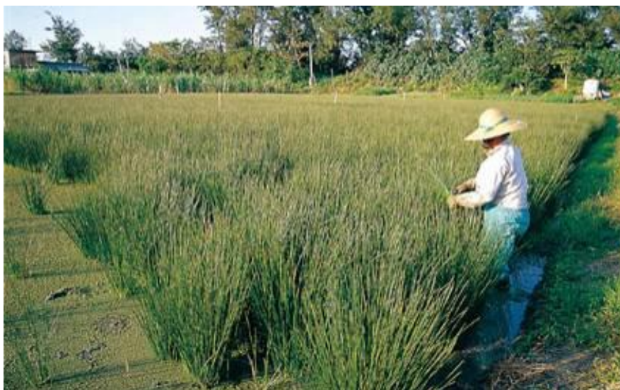
照間のイグサ(ピーグ)畑(与那城照間・字照間)

こうした良好な景観を形成する農地については、景観と調和のとれた良好な営農環境を確保するため、必要に応じて「景観農業振興地域整備計画」の策定を検討します。