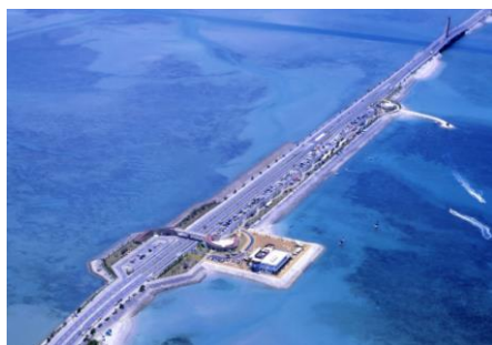
海中道路・ロードパーク(与那城)

県道16号線は、平成29年に景観重要公共施設に指定されたことから、当初の指定候補から削除します。なお、重要公共施設指定の指定に基づく整備の方針等については、第7章に記載します。