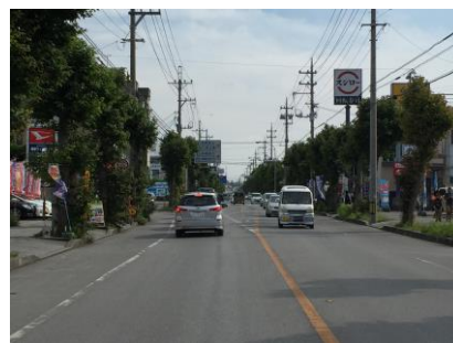
沖縄石川線(県道75号線)