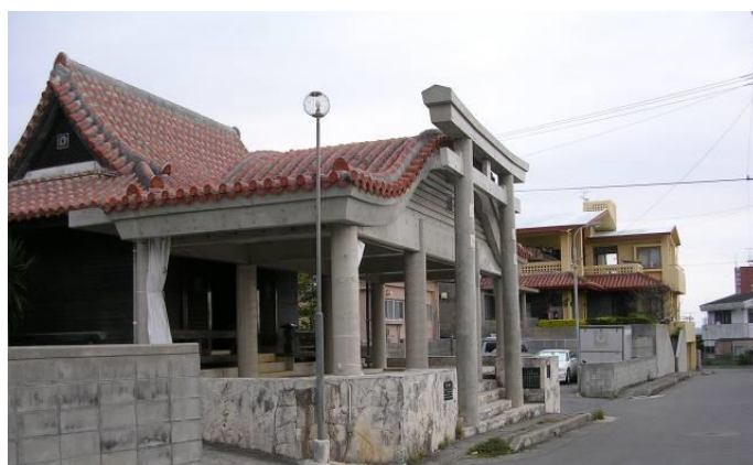
景観重要建造物のイメージ