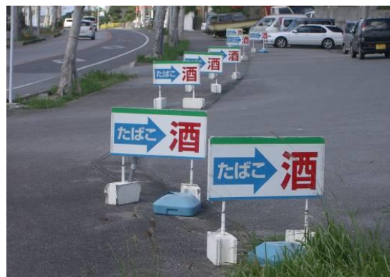
屋外広告物のイメージ