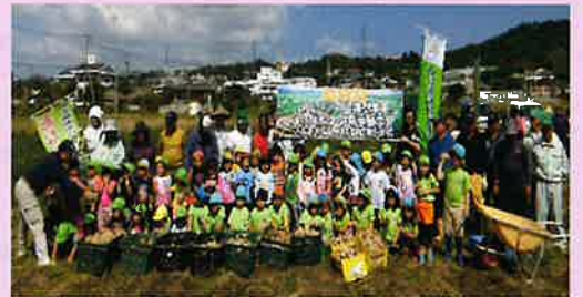
《↑見える化運動・食育活動》