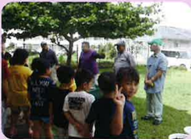
《学童クラブ野菜栽培教室》