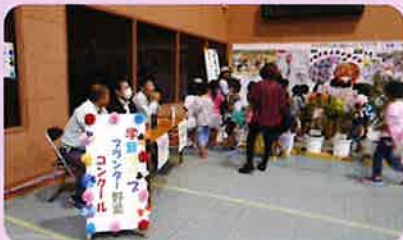
↑《学童クラブ野菜栽培コンテスト》↑