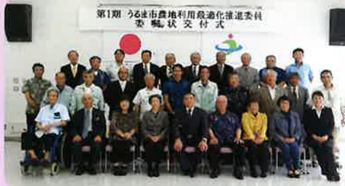
《第16期農業委員・推進委員》