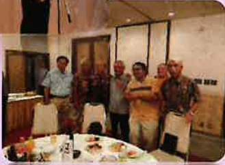
《市長・議長との懇談会》