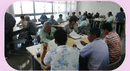
《ファシリティー研修会》