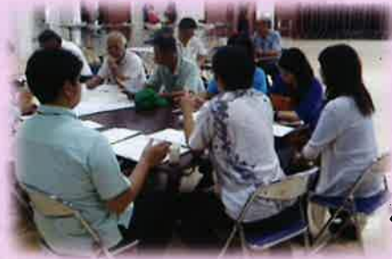
《人・農地プラン意見交換会》