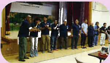
《青年農業者懇談会》