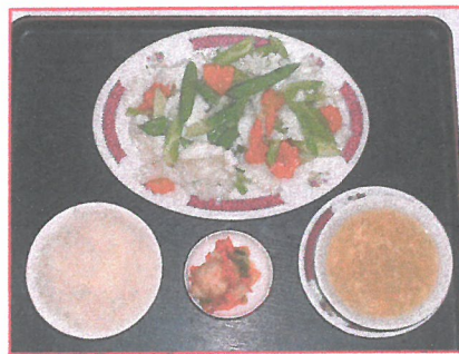
38. セロリとイカの炒め物