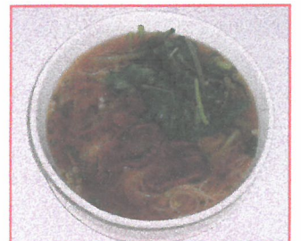
50. チャーシューラーメン