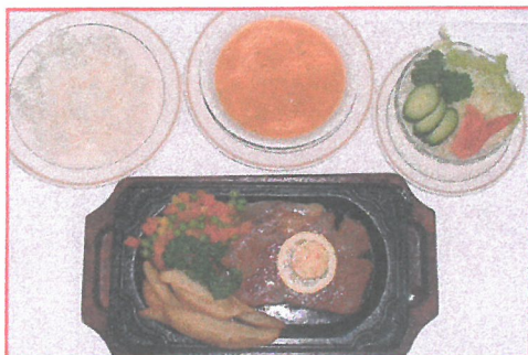
76. リブローズステーキ