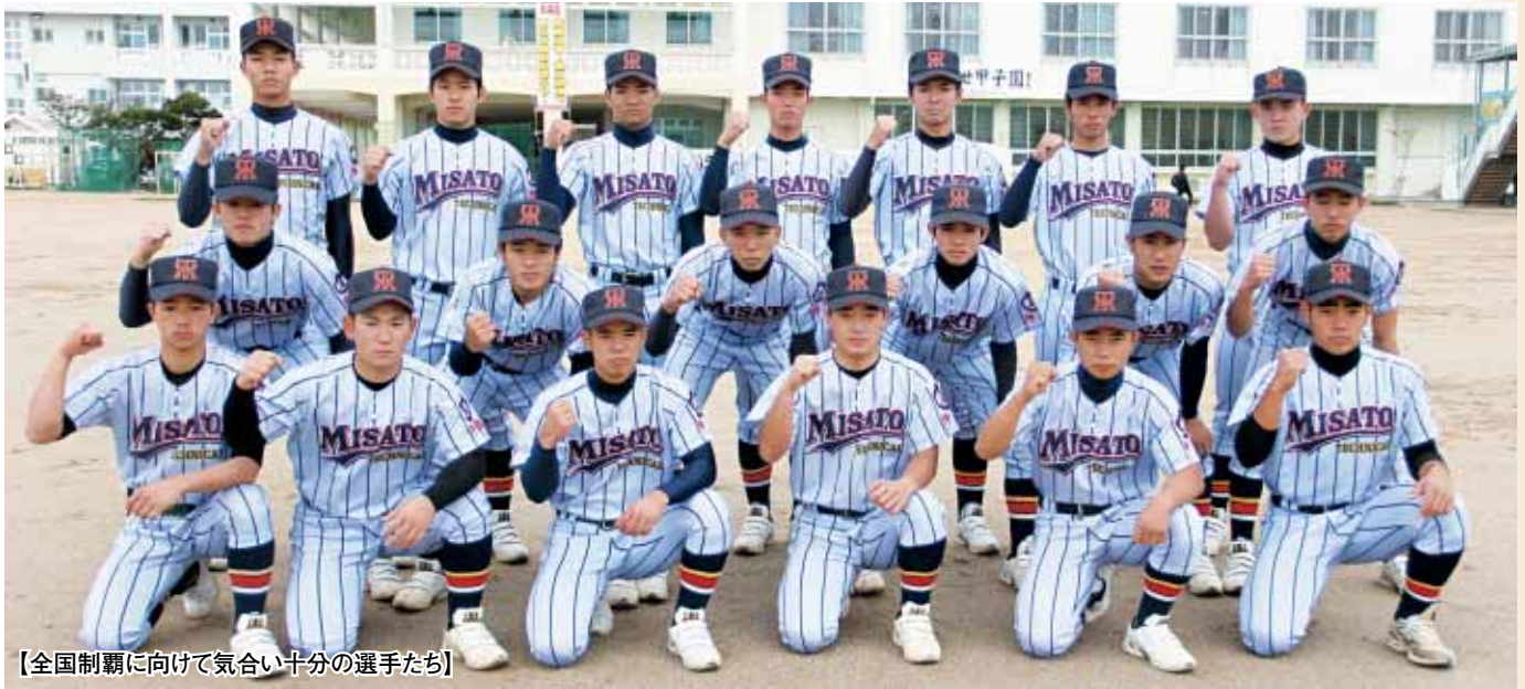
【全国制覇に向けて気合い十分の選手たち】