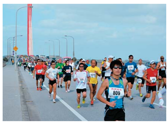
【第13回あやはし海中ロードレース大会】

「磯のかおりを楽しみながら、海中道路を走ろう」を合言葉に、『第14回あやはし海中ロードレース大会』が行われます。あやはしの潮風を浴びながら汗を流しませんか。今年も多数のご参加をお待ちしています。申し込み方法、期間などについては詳細が決まり次第、お知らせします。 【とき】平成26年4月6日(日)開催予定 ※雨天決行 【ところ】うるま市与那城総合公園陸上競技場 【予定申込期間】平成26年1月上旬〜平