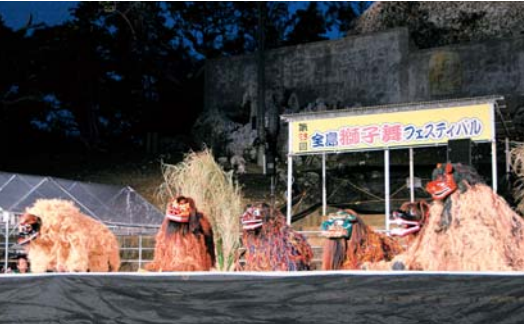
【オープニングで勢揃いの獅子たち】

第28回全島獅子舞フェスティバル(主催…うるま市教育委員会、共催…沖縄タイムス社)がうるま市安慶名闘牛場で開催されました。金武町並里の獅子舞で幕開けし、県内7団体が、各々の特色を活かした迫力ある舞で観客を魅了。離島からは石垣市平得が参加し、勢いある舞で会場を沸かせました。ラストを飾ったのはうるま市勝連南風原獅子舞。唐船ドリーの音に合わせて獅子が観客席に飛び込むと、われ先にと獅子を触りに行く方や、怖くて泣き叫ぶ子ども等、様々な表情であふれかえりました。