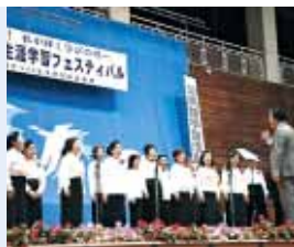
▲あやはし歌声サークル (与那城地区公民館) 去年の公民館講座から 発足した初出場の サークル