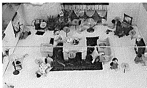
子どもの事故予防啓発用手づくり教材はリビング、キッチン、浴室・トイレ・ベランダなど3種