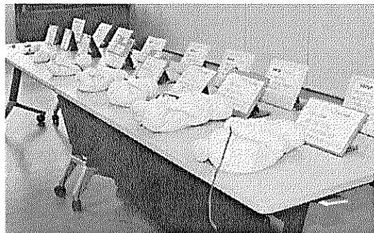
手づくりオリジナル教材の胎児模型

各支部（保健所単位）を設置するとともに、組織未設置の市町村に対しては協議会を作るよう、県協議会から働きかけをしている。市町村協議会を設置し、県協議会に加入することの意義を沖縄県協議会積静江会長に聞いたところ、以下の2点をあげた。