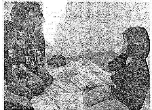
真剣な表情で計測の実習に臨む母推さん（左）

母推さんそれぞれが工夫をして訪問を 実の多いものとしている。「母推さんの中には20年以上活動を続けている方もいらして、その工夫、経験を新しく入られる方々に伝えて下さっています。市で研修も行いますが、経験からの工夫も大きな財産です。」(母子担当)