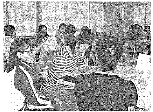
グループワークで情報や悩みを共有して