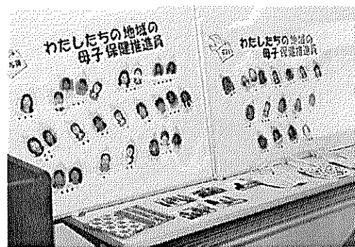
担当の母推さんを写真入りで紹介、机の上には訪問時プレゼント用手作り母子健康手帳入れとスタイ

・子どもが好き、自分も勉強になると母推活動を続けてきましたが、協議会ができて他地区の活動もわかり、よいものは互いに取り入れたりして活動の幅が広がり、今は私自身が楽しんでいます。(母推さん)