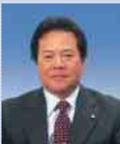
副議長 宮城 茂