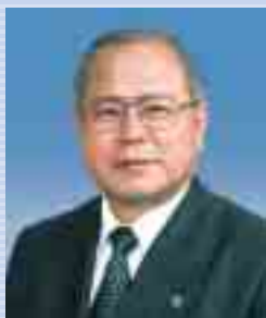
市長 知念 恒男