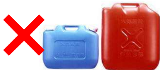
ガソリンの貯蔵に適さない容器の例 (樹脂製容器は火災危険性が高い)