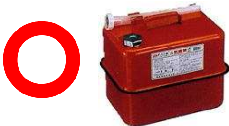
ガソリンの貯蔵に適した容器の例 ( 金属製容器であることが必要 )